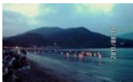
2011年8月 敦賀市、気比の松原の海での精霊流し